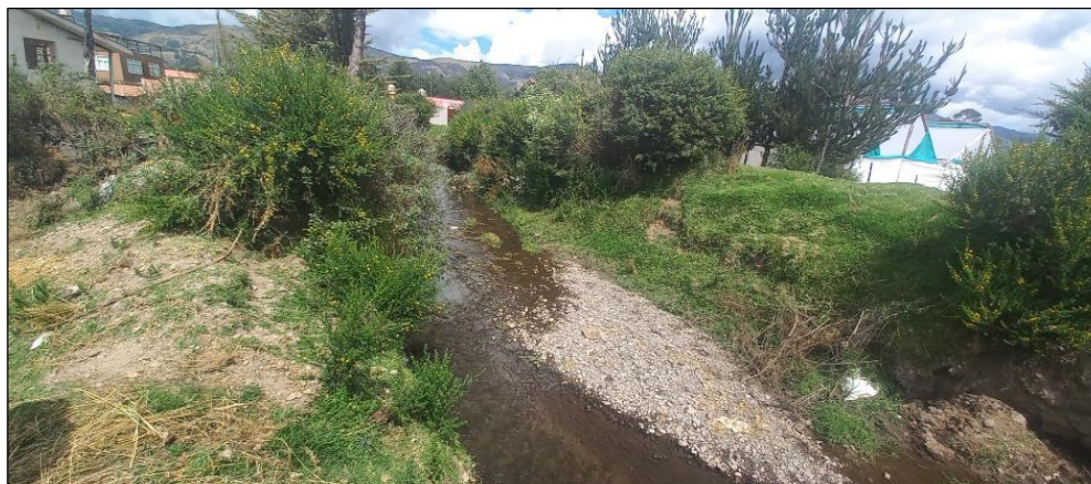
FIGURA N°01: TRAMO CRÍTICO EN EL RIO CCONCHACALLA, DISTRITO DE ANTA, PROVINCIA DE ANTA, SE APRECIA EL CAUCE COLMATADO.